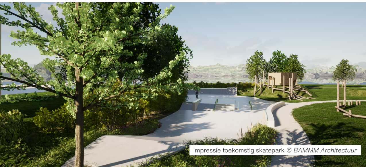
Impressie toekomstig skatepark © BAMMM Architectuur

*Ter compensatie van de verharding zal de gemeente extra ontharden op de site rond Spikkerelle.