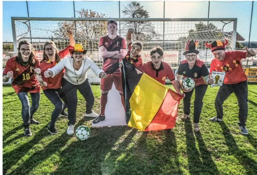
Ter gelegenheid van het WK organiseert de gemeente een WK-pronostiek voor de lokale handelaars.

Avelgem gaat op zoek naar grootste voetbalkenner